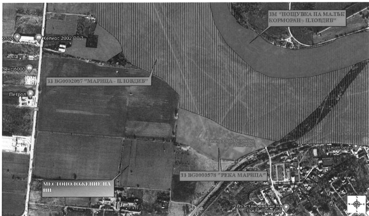
Местоположение на ИП, спрямо най-близко разположените елементи на Националната екологична мрежа (НЕМ)