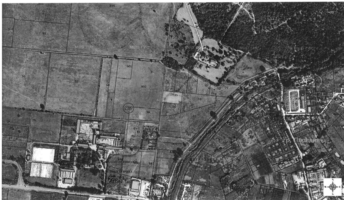
Местоположение на имота (със син контур), в който ще се реализира ИП