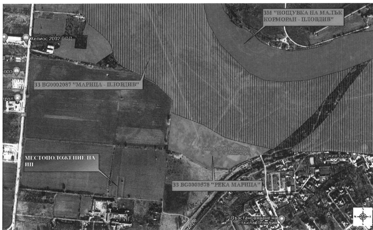
Местоположение на ИП, спрямо най-близко разположените елементи на Националната екологична мрежа (НЕМ)