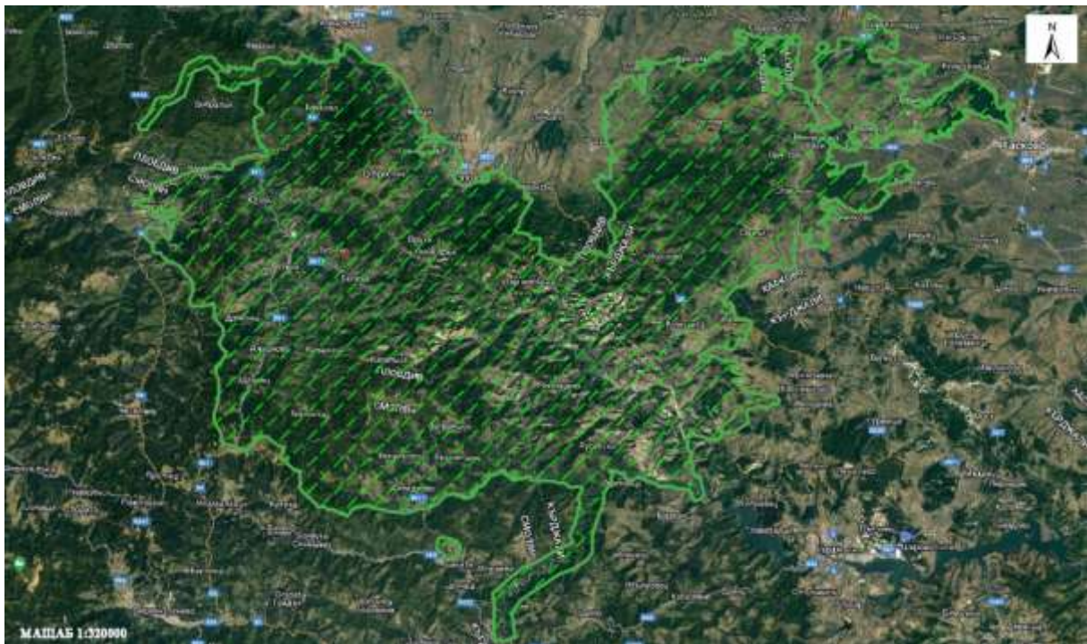
Фигура 4. Карта с местоположението на Защитена зона BG0001031 “Родопи - Средни” (със зелени щрихи)

В по-високите райони на защитената зона се намират добре запазени иглолистни и букови гори, а в по-ниските - дъбови. Добростанският рид, в който се намира и