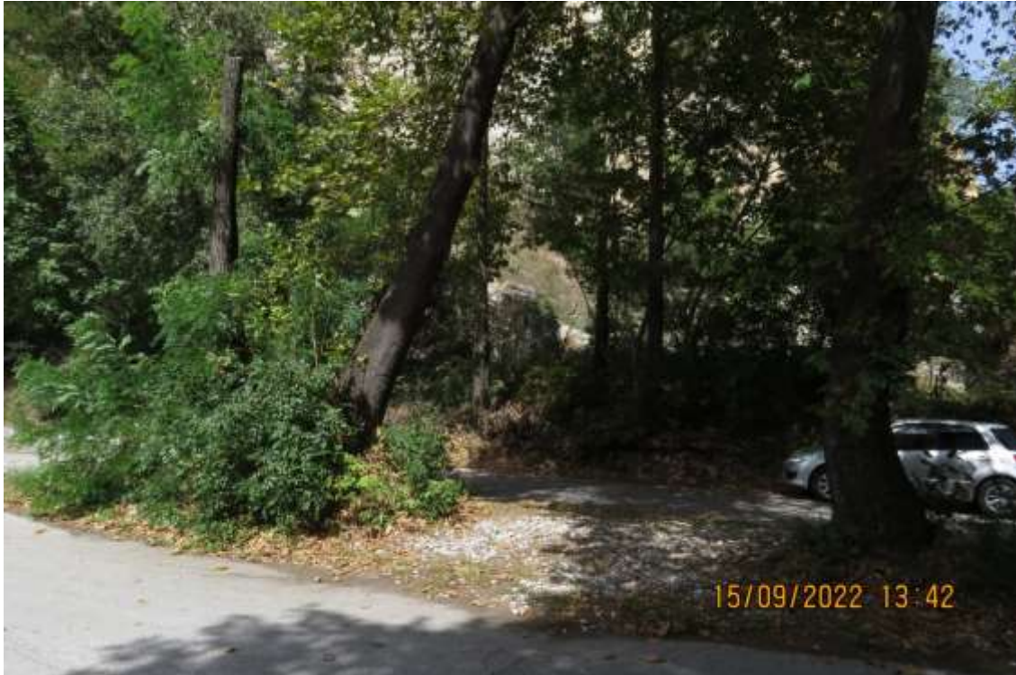
Снимка 1. Изглед към единични източни чинари ( Platanus orientalis ) и бял салкъм ( Robinia pseudoacacia ) в централната част на ПИ 02974.7.88