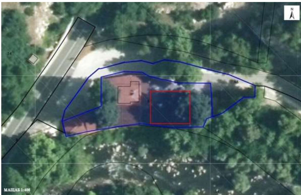
Фигура 3. Идеино ситуиране (с червен контур) на площадката за застрояване в ПИ 02974.7.87

2. Описание на характеристиките на други планове, програми и проекти/инвестиционни предложения, съществуващи и/или в процес на разработване или одобряване, които в съчетание с оценяваното инвестиционно предложение могат да окажат неблагоприятно въздействие върху защитените зони