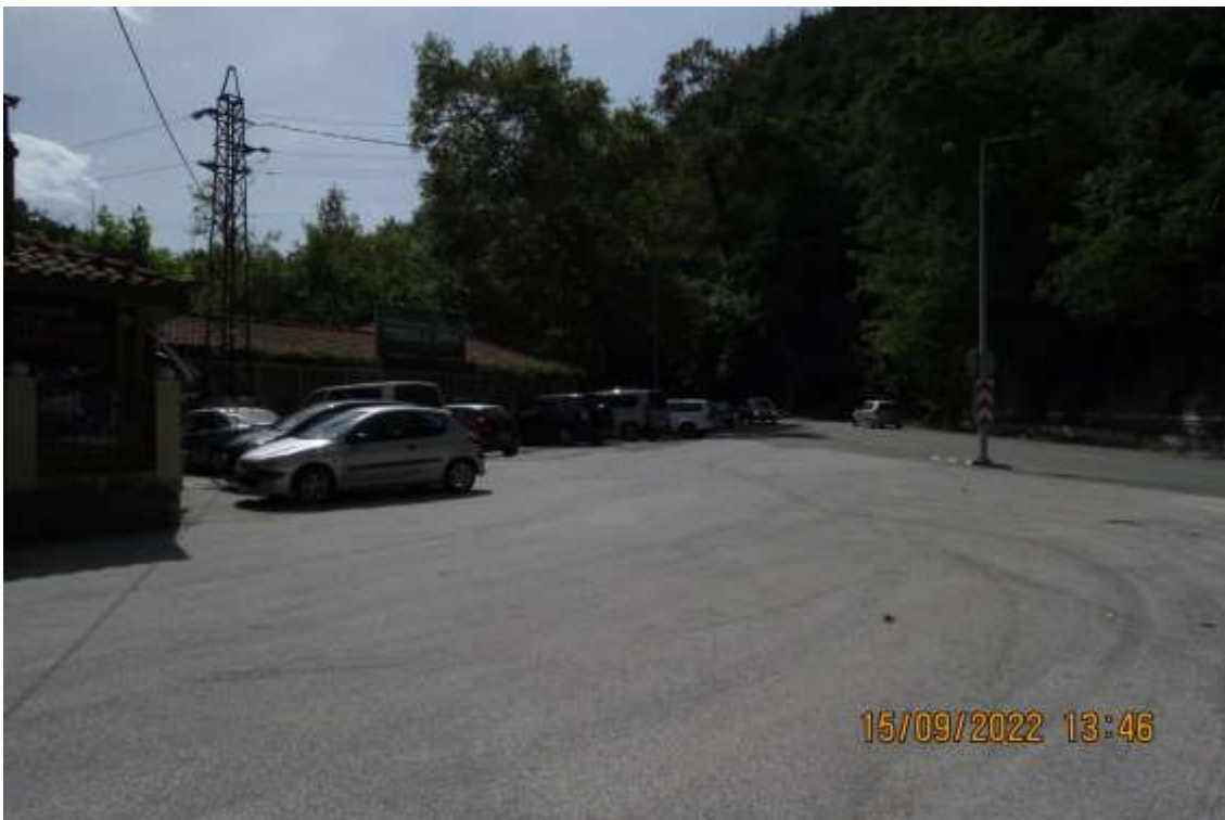
Снимка 2. Изглед към западните части на ПИ 02974.7.87, ПИ 02974.7.88 и част от път Е-86

ДОКЛАД за оценка за степента на въздействие на инвестиционно предложение: „Изграждане на хотел ресторант и кафе-аператив“ в поземлени имоти с идентификатори 02974.7.87 и 02974.7.88 по КК и КР на землището на с. Бачково, община Асеноград, област Пловдив, върху защитени зони BG0001031 „Родопи - Средни“ съгласно Директива 92/43/ЕИО за опазване на природните местообитания и на дивата флора и фауна и BG0002073 „Добростан“ съгласно Директива 2009/147/ЕО за опазване на дивите птици