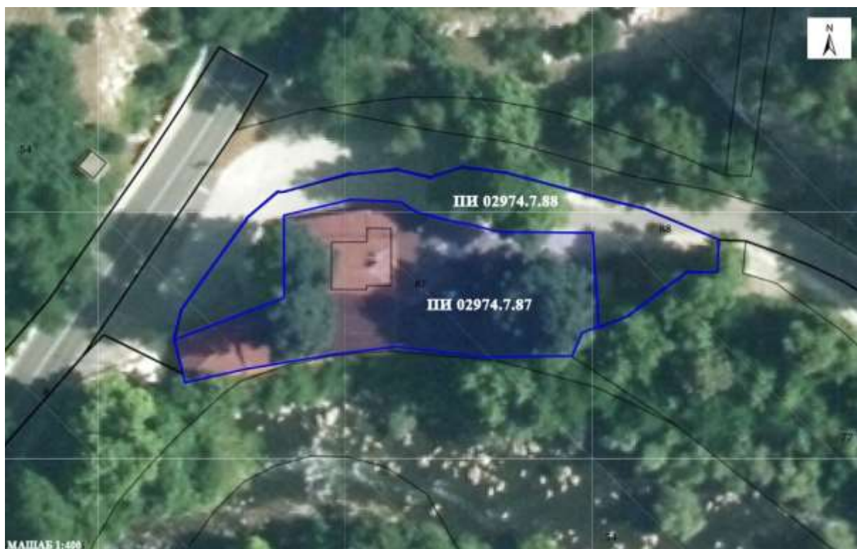
Фигура 2. Местоположение и граници на ИП с идентификатори 02974.7.87 и 02974.7.88

ДОКЛАД за оценка за степента на въздействие на инвестиционно предложение: „Изграждане на хотел ресторант и кафе-аператив“ в поземлени имоти с идентификатори 02974.7.87 и 02974.7.88 по КК и КР на землището на с. Бачково, община Асеновград, област Пловдив, върху защитени зони BG0001031 „Родопи - Средни“ съгласно Директива 92/43/ЕИО за опазване на природните местообитания и на дивата флора и фауна и BG0002073 „Добростан“ съгласно Директива 2009/147/ЕО за опазване на дивите птици